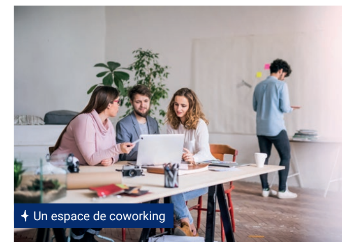
↑ Un espace de coworking