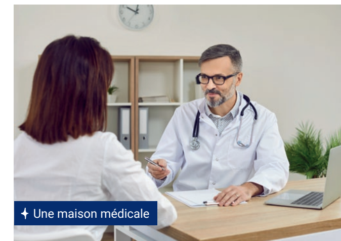
↑ Une maison médicale