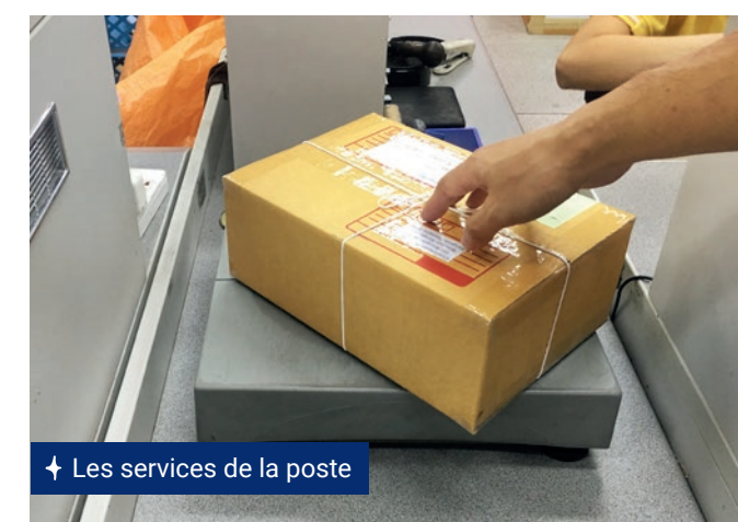
↑ Les services de la poste